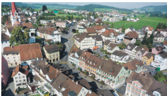
Interessante Einblicke in die Geschichte des Fleckens.

Freut euch auf spannende Einblicke und unerwartete Geschichten. Lasst euch von den Geheimnissen, kuriosen Anekdoten und faszinierenden Fakten mitreissen. Packt eure Neugier aus und lasst euch überraschen!