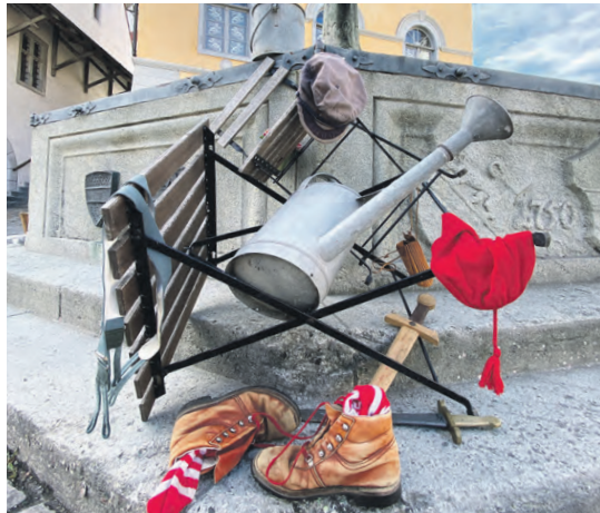
Streiche spielen wie anno dazumal: Für die neue Ortsführung in Beromünster werden Schauspieler gesucht.

Gesucht sind jetzt Schauspielerinnen und Schauspieler: Leute, die in die Rolle eines gewitzten Lausbuben schlüpfen und ein Publikum eine Stunde lang in den Bann ziehen können. Dabei nehmen sie es spielerisch