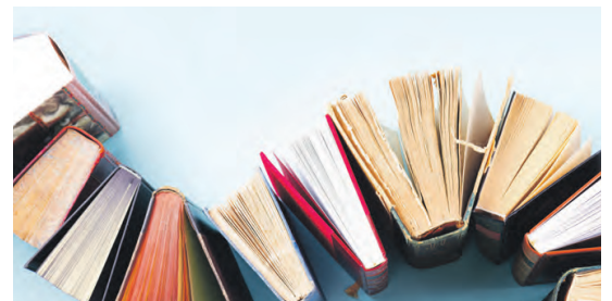
Lesen bildet und macht Spass.