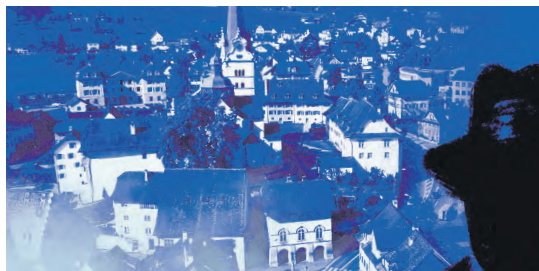
Rätsel an verschiedenen Standorten in Beromünster.

Das Outdoor Escape Game in Beromünster mit deinem Smartphone: Starte den Timer, löse mit Teamplay die Rätsel an den verschiedenen Standorten und chatte mit dem wahnsinnig gewordenen Kriminellen. Ein actionreicher Ausflug für den Teamevent, Schulklassen, Freunde, Paare und Familien mit Teenagern (ab 12 Jahren). Benötigte Zeit zum Finden des Geheimcodes: zirka 2 Std. 15 Min. Kosten: 40 Franken (1–5 Personen), für Schulen 20% Rabatt Buchen unter: find-the-code.ch/produkt/beromuenster/